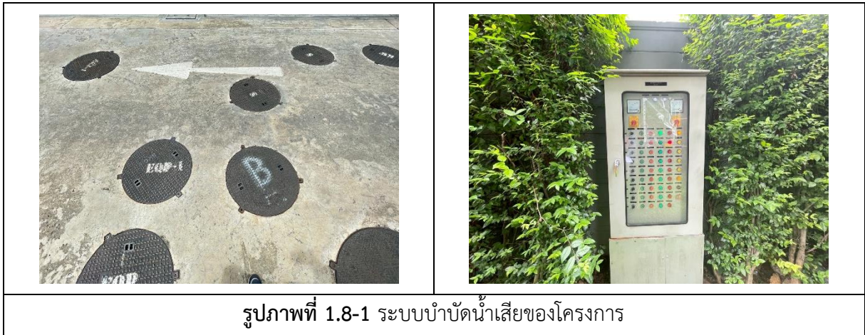
รูปภาพที่ 1.8-1 ระบบบำบัดน้ำเสียของโครงการ