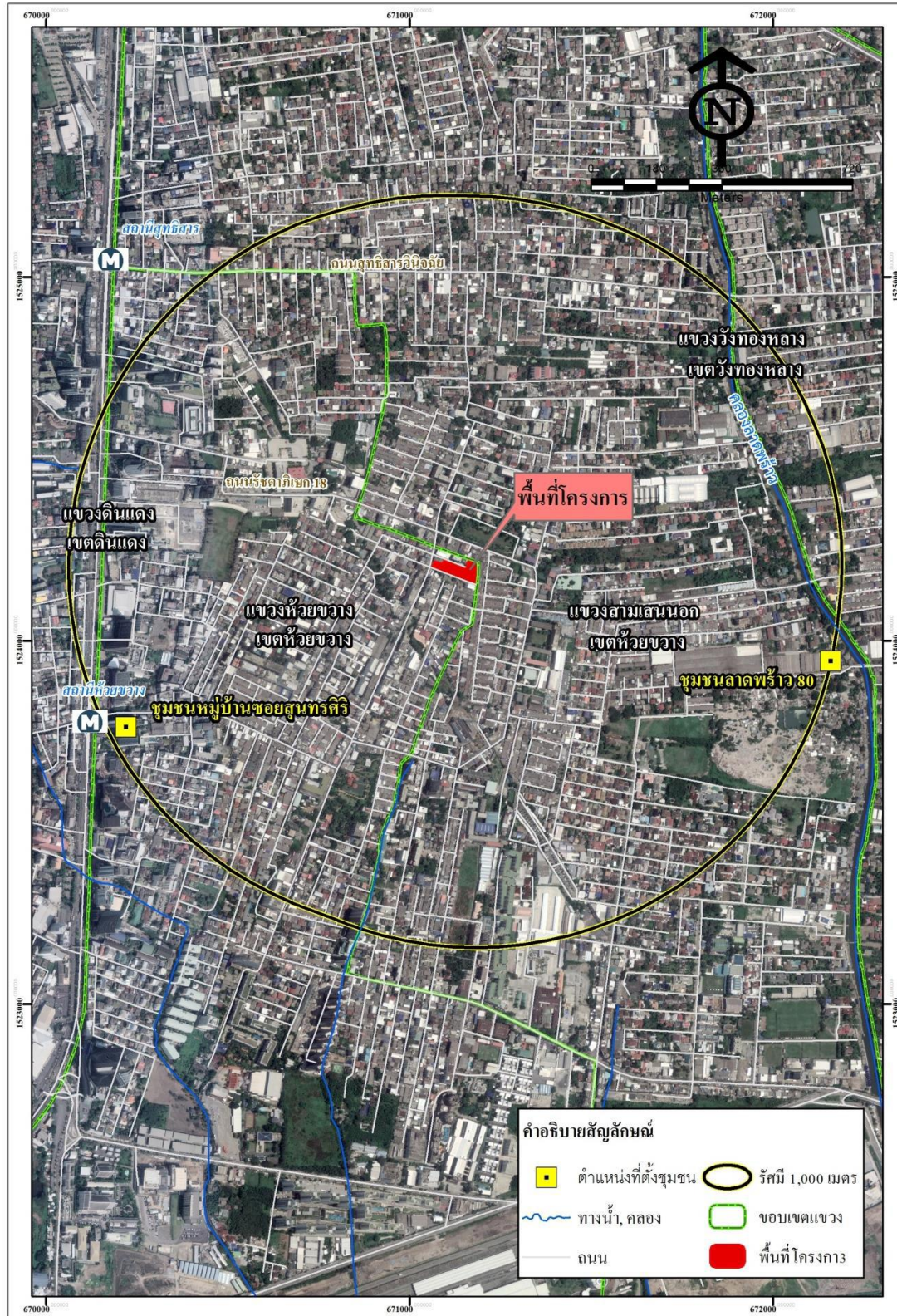
รูปภาพที่ 1.4-1 ที่ตั้งพื้นที่โครงการ